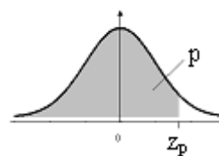
Tabela I: Distribuição Normal Padrão Acumulada

Fornece \Phi(z) = P(-\infty < Z \leq z) , para todo z , de 0,01 em 0,01, desde z = 0,00 até z = 3,59 A distribuição de Z é Normal(0;1)