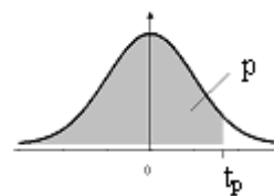
Tabela II: Distribuição t de Student

Fornece o quantil t_p em função do n° de g.l. v (linha) e de p = P(T \leq t_p) (coluna) T tem distribuição t de Student com v g.l.